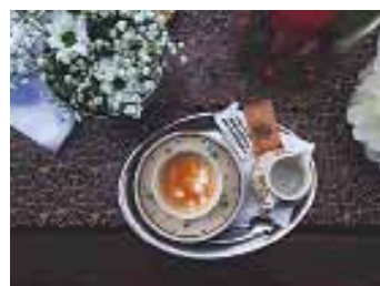
Kozí chlívěk nabízí kromě ubytování a restaurace třeba i saunu

Penzion za mlýnem je historická zemědělská usedlost, kterou najdete v malebné vinařské obci Slup na Znojemsku. Bydlet zde budete ve více než 200 let starém domě, který tvoří samostatné uzavřené hospodářství – stačí jen vstoupit, zavítat vrata do ulice, a rázem se ocitnete v čase našich prababiček. Penzion nabízí dva dvoulůžkové pokoje (s možností jedné přistýlky) zařízené starožitným nábytkem – světlým a tmavým – a společnou kuchyňku a sociální zařízení (proto je lepší sem vyrazit jako rodina nebo se skupinou přátel). Vaše děti určitě ocení, že v hospodářství najdou koně, prasátko či kočky zvyklé na mazlení. V létě si tu také dopřejete meruňky, broskve, švestky, blumy či hrušky