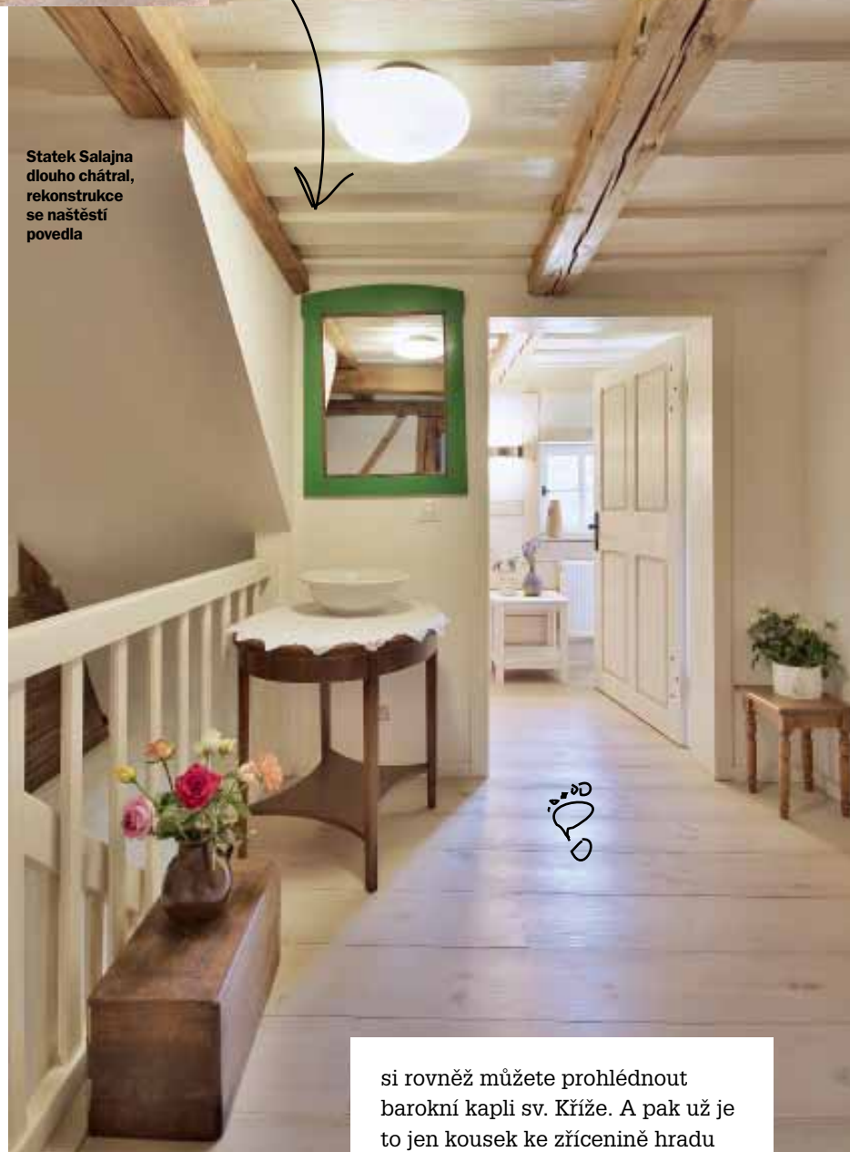
Statek Salajna dlouho chátral, rekonstrukce se našťastí povedla